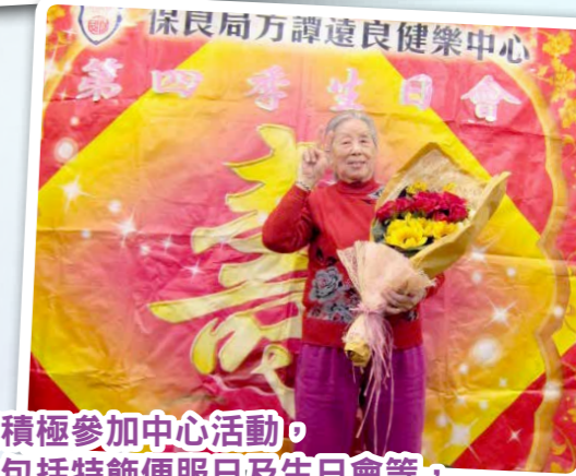
翠麗積極參加中心活動，當中包括特飾便服日及生日會等，不但擴闊翠麗的社交圈子，同時亦增加了對中心的歸屬感。