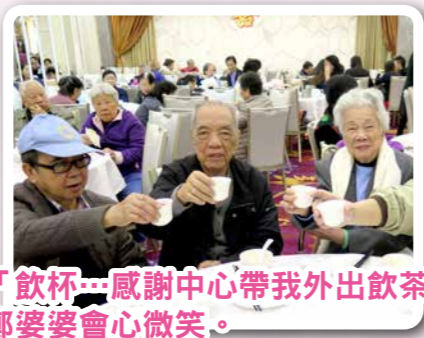
「飲杯茶感謝中心帶我外出飲茶。」 鄭婆婆會心微笑。