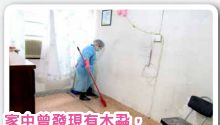
家中曾發現有木蝨， 感激當時護理員清潔家居環境。

鄭婆婆居住的單位為公共屋邨，樓齡超過50年，家居設施未能配合長者身體衰退的需要，鄭婆婆表示「感謝中心幫我重修地板及窗口，讓我少了一份擔心。」由職業治療師馮先生上門評估及改善家居環境安全，協助安裝防跌設施，例如安裝扶手，及地板改善工程，預防跌倒。