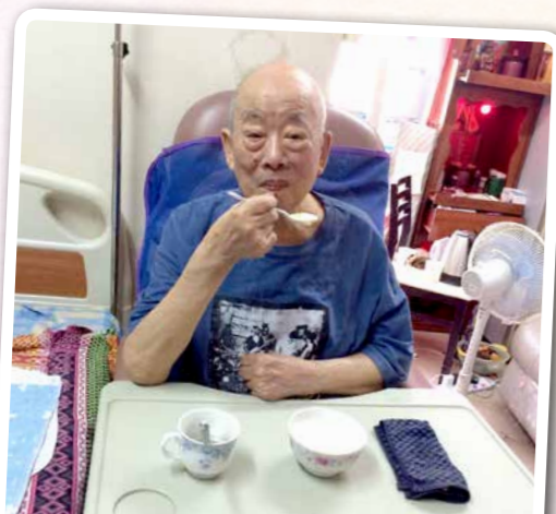
長者不需要再用胃喉, 可以自己進食

我們時常與長者兒子聯絡, 他表示我們的服務有助家人照顧長者, 尤其是改善了爸爸的吞嚥能力, 經醫院言語治療師評估後, 不需再使用胃喉。另一方面, 職員經常與長者傾談, 令他心情開朗不少。而服務券具彈性的服務安排, 令工人有更充裕的時間做其他家務。