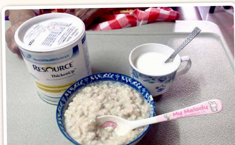
治療師到戶使用長者家中普通食具及凝固粉進食訓練