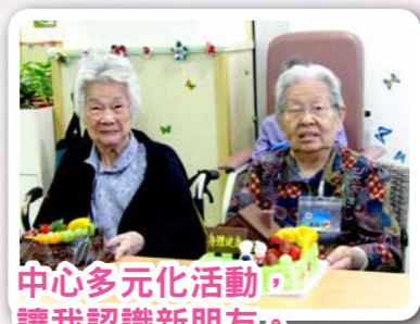
中心多元化活動， 讓我認識新朋友。