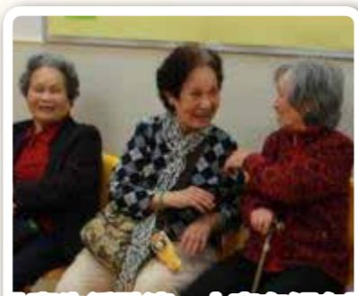
分享生活點滴，大家有傾有講

另一方面，為了讓黃金婆婆有更多鍛煉下肢肌力的機會，護理員與她於社區「慢步同行」，一同乘搭港鐵回家，這個「腳踏實地」的訓練，有助加深她對回家路線的印象。同時，護理員亦會鼓勵黃金自行使用八達通，自行辨別鐵路圖及車站設施，讓她在安全的情況下，重拾過去的日常生活，加強與社區的接觸，提升自理能力。