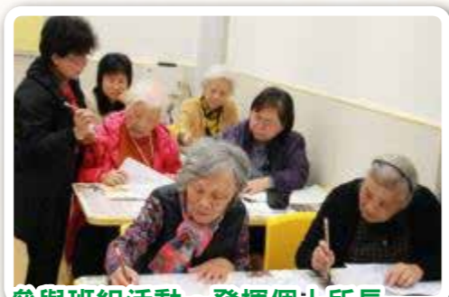
參與班組活動，發揮個人所長