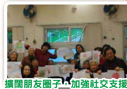
擴闊朋友圈子，加強社交支援