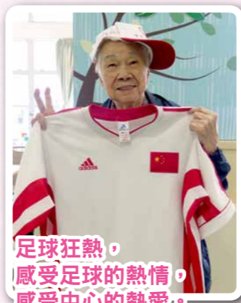
足球狂熱， 感受足球的熱情， 感受中心的熱愛。