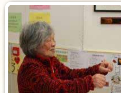
勤做健體運動，保持身體健康